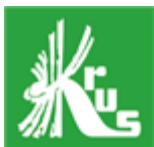
logo KRUS do zamieszczenia na środku koła