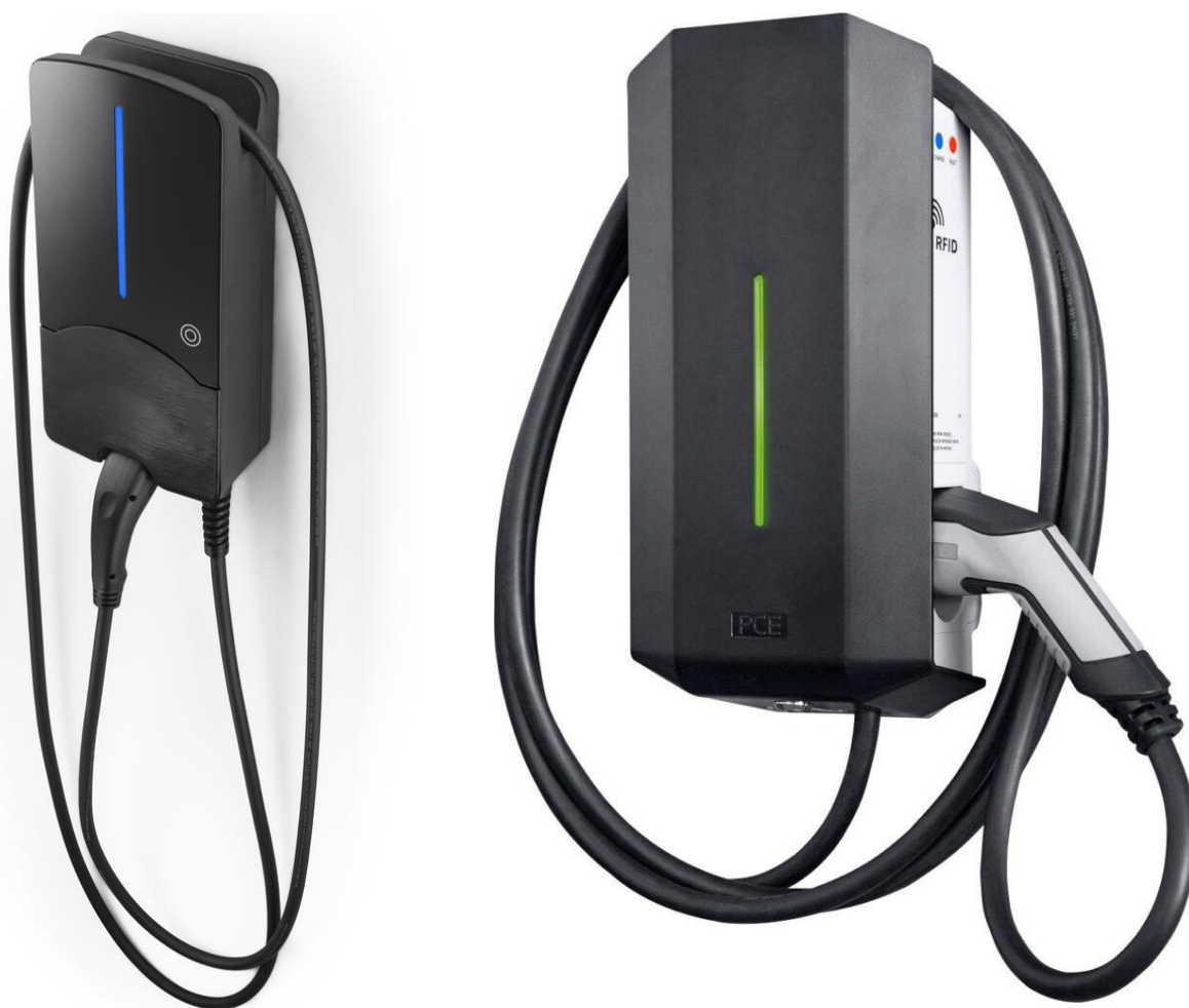
Zdjęcia poglądowe przykładowych urządzeń

Przedmiotem umowy jest dostawa wraz z montażem stacji ładowania typu „Wallbox” korzystającej z prądu przemiennego AC do ładowania samochodów elektrycznych z maksymalną mocą do 22 kW.