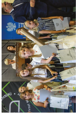
Laureaci I kategorii wiekowej