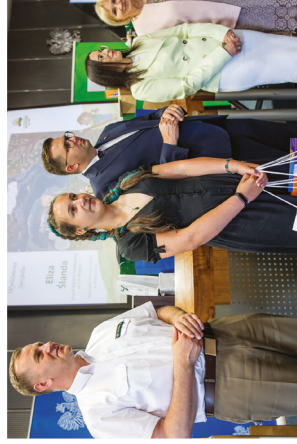
Laureatka II kategorii wiekowej