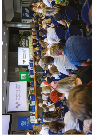
Gala Finałowa Konkursu Plastycznego dla Dzieci