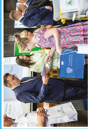
Wręczenie nagród przez Wojewodę Małopolskiego Łukasza Krniłę