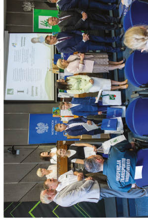
Laureaci Konkursu na Rymowankę