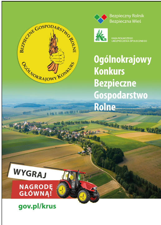
Roll-up konkurs BGR 150x200