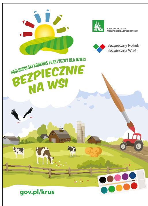
Roll-up konkurs plastyczny 150x200