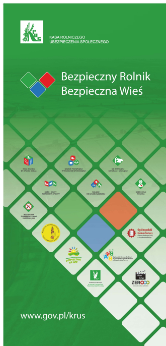
Roll-up BRBW 100x200