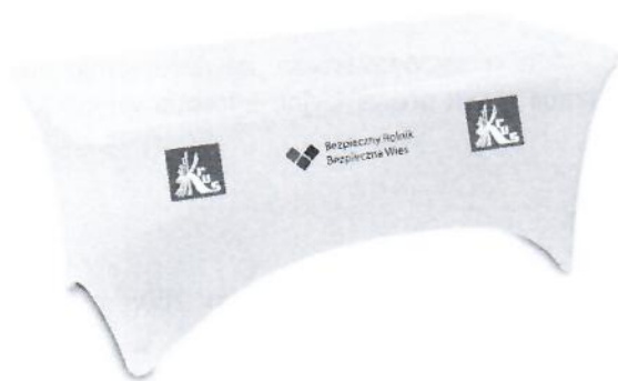
Widok stołu z pokrowcem