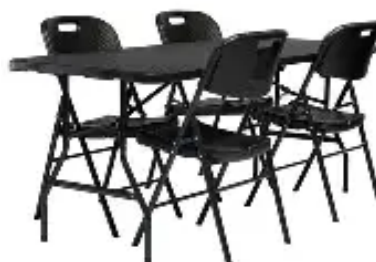
Zdjęcie poglądowe 2