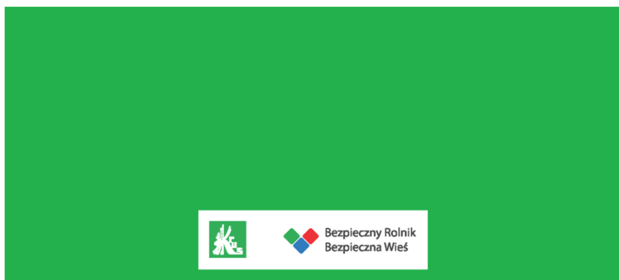
Zdjęcie poglądowe 3

Nadruk: logotyp i hasło : Bezpieczny Rolnik Bezpieczna Wieś (wzór 1).