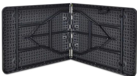
Zdjęcie poglądowe 1

Na każdym krześle na oparciu naklejka z logotypem: Bezpieczny Rolnik Bezpieczna Wieś (wzór 1)