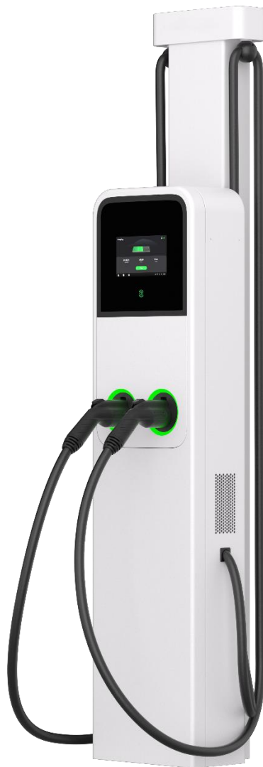
Zdjęcia poglądowe przykładowych urządzeń